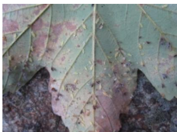
Photo : Face inférieure d'une feuille d'érable présentant une forte attaque de pucerons (Fredon Limousin)