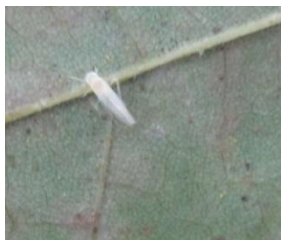
Photo : Larve de cicadelle sur feuille de platane