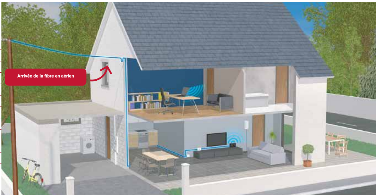
Arrivée de la fibre en aérien