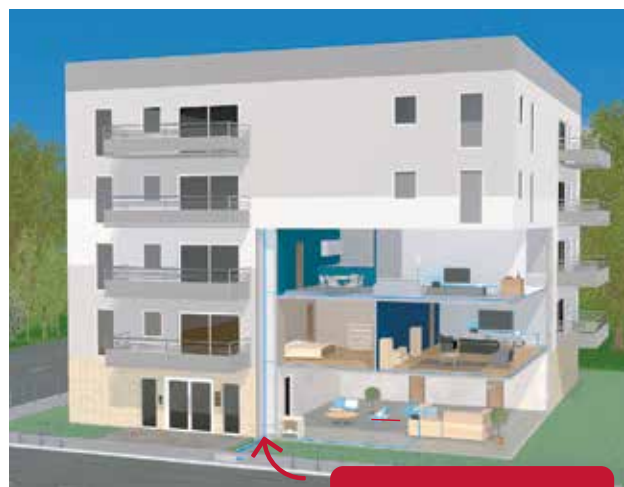
Arrivée de la fibre en souterrain

La fibre emprunte généralement le même chemin que le réseau télécom cuivre déjà en place quand il existe. S'il n'existe pas ou si ce passage n'est pas identifié, une solution est proposée par le technicien de raccordement.